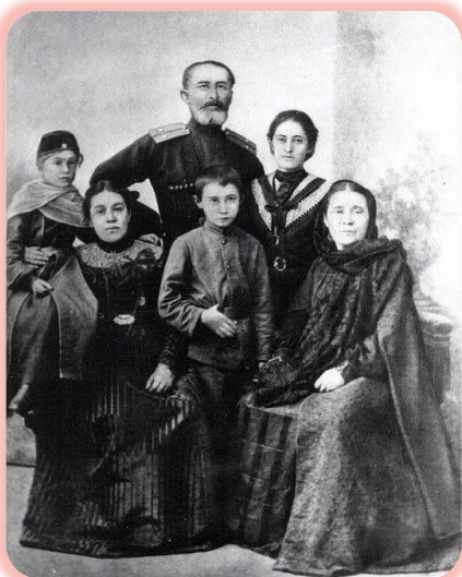
ШОРА БЕКМУРЗОВИЧ НОГМОВ (1794–1844)

Уроженец Кабарды. Получил восточное образование, владел несколькими языками, включая русский. Собирал фольклор, создал основы письменности кабардинского языка. Автор труда «История адыгейского народа», включившего культуру Кабарды в общероссийское научное пространство.